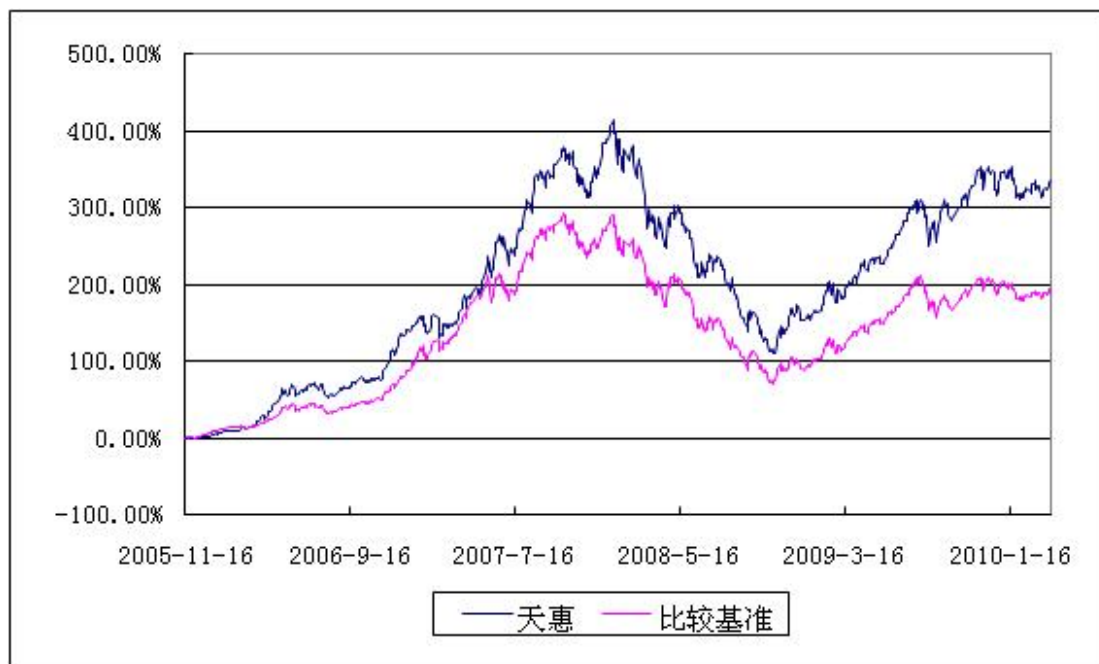
净值增长率与业绩比较基准收益率的历史走势对比图